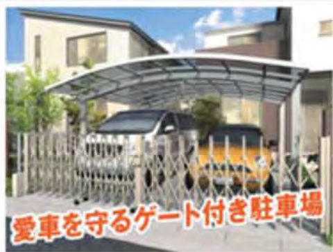
カーポート・カーゲート設置