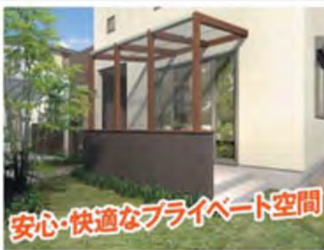
ガーデンルーム・タイルデッキ設置