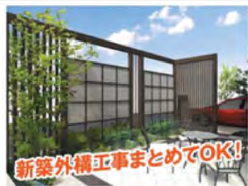
目隠し・タイルテラス設置